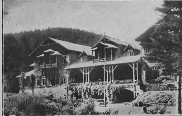
Rymanów — Zdrój: Dom zdrojowy

Z pensjonatów najpiękniejsze są: „Zofja”, „Teresa”, „Pod Matką Boską”, „Pogoń i Gwiazda” — urządzone z komfortem, jak również we wsi są liczne domki z kuchniami, które pozwalają każdemu urządzić się według możliwości, tanio i dobrze.