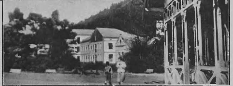
Rymanów — Zdrój: murowane łazienki